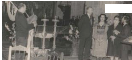
Entonces fue la primera vez: la tarde del 5 de mayo de 1978