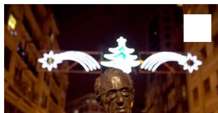
Oviedo enciende las Luces de Navidad