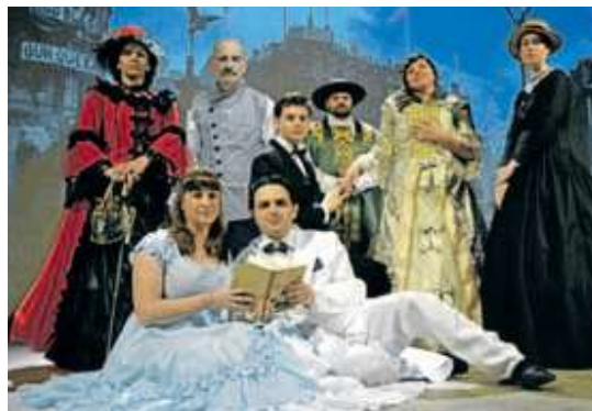
"La Cascaya", mejor grupo en la pasada edición. | LA CASCAYA

La cita es un adelanto a la de Navidad. Aunque hasta ahora esta costumbre de las rebajas anticipadas no estaba muy arraigada en la sociedad de la zona, en Apeasa aseguran que el año pasado los establecimientos que apostaron por ella notaron como se animó el consumo y se adelantaron compras navideñas.