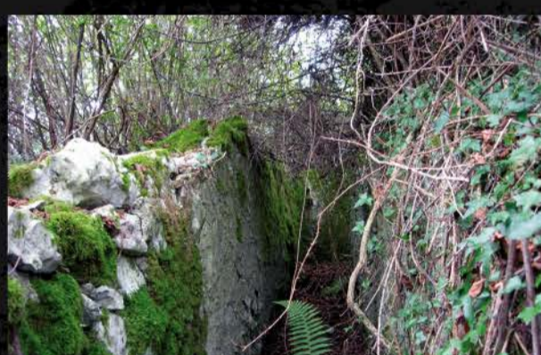
Trinchera en Pico Castiello (Oviedo)