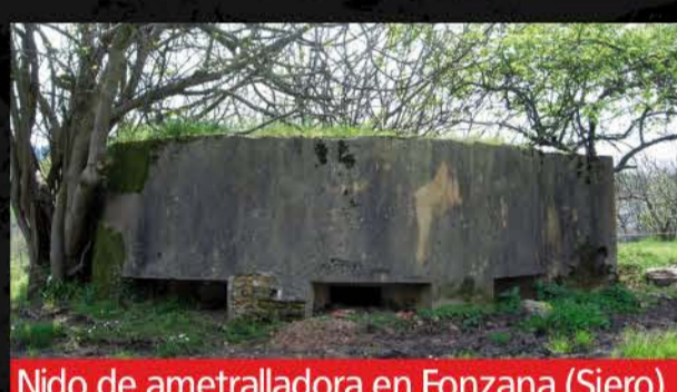
Nido de ametralladora en Fonzana (Siero)