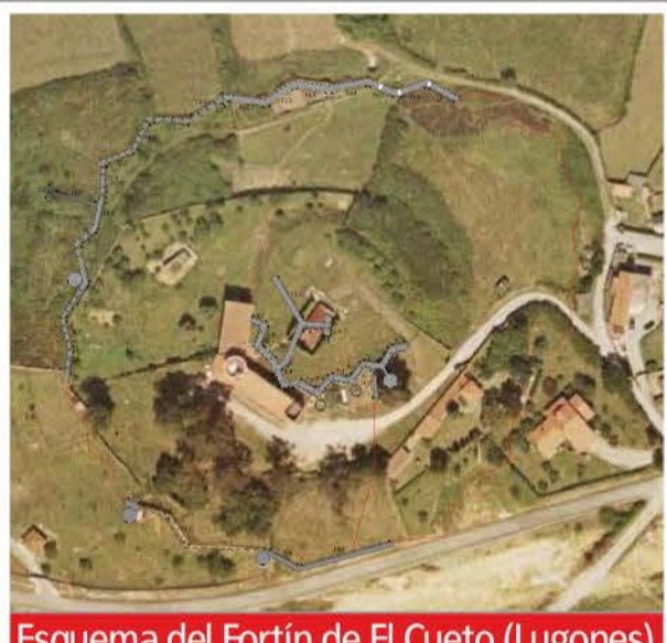
Esquema del Fortín de El Cueto (Lugones)

De todo ello solamente se finalizó el reducto central y una primera línea de trinchera blindada rodeándolo con varios nidos de ametralladora.