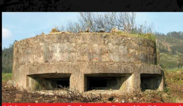
Nido de ametralladora en Caraviés (Llanera)