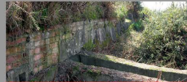
Exterior de la trinchera blindada de El Cueto