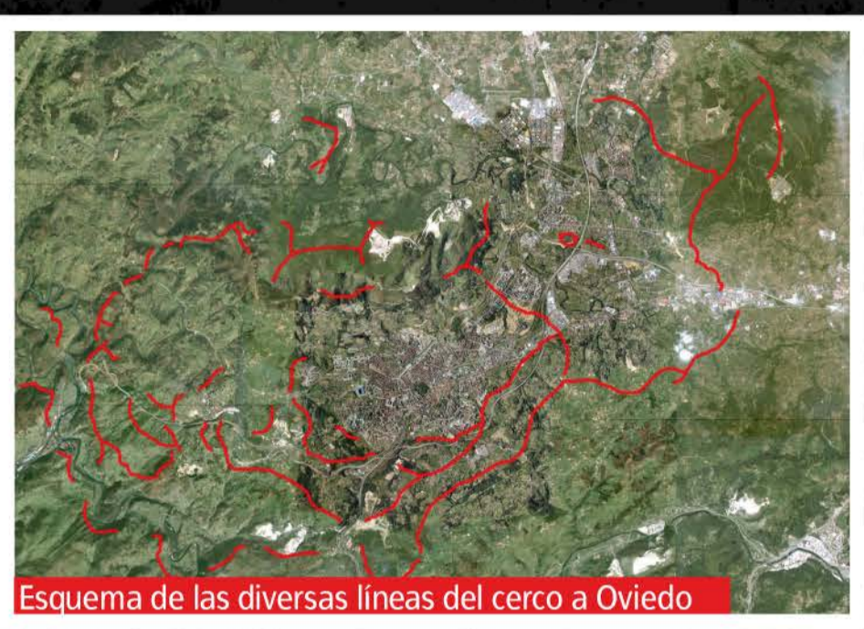
Esquema de las diversas líneas del cerco a Oviedo

Fue el cerco de Oviedo el que concentró los mayores esfuerzos, tanto humanos como constructivos, buscando los republicanos tomar la capital del Principado sin conseguirlo. Para ello construyeron hasta cinco líneas defensivas en torno a la ciudad, con numerosas baterías artilleras que castigaban a la capital. No en vano, fue la capital de provincia española que sufrió más daños.