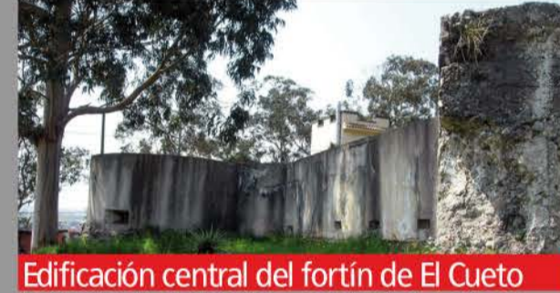
Edificación central del fortín de El Cueto