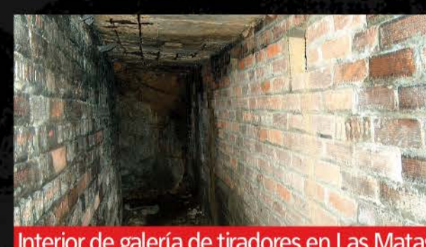
Interior de galería de tiradores en Las Matas