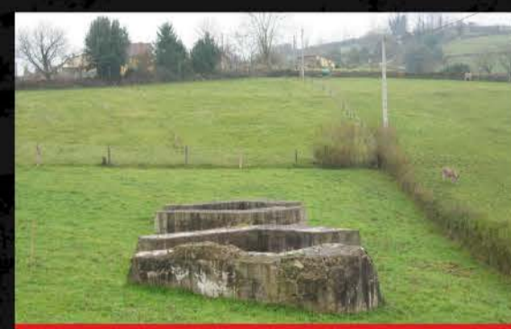
Casamatas de artillería de Felech's (Oviedo)