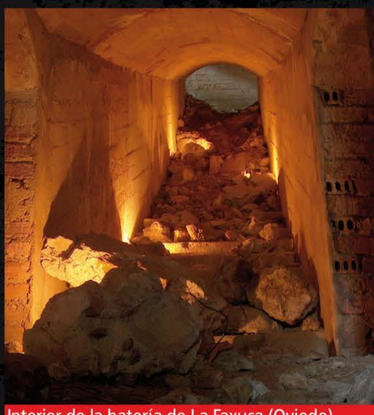
Interior de la batería de La Faxuca (Oviedo)

Estas baterías de artillería estaban apoyadas con otras construcciones: trincheras, refugios, puestos de observación y, sobre todo por su número, nidos de ametralladora, que se distribuyen por todo el territorio.