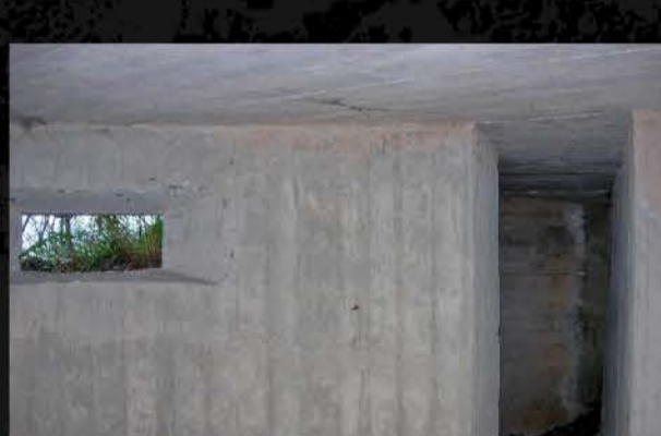
Interior de un nido de ametralladora en Siones (Oviedo)