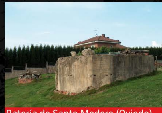
Batería de Santo Medero (Oviedo)