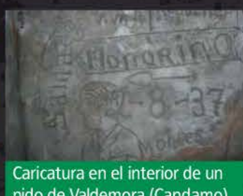
Caricatura en el interior de un nido de Valdemora (Candamo)