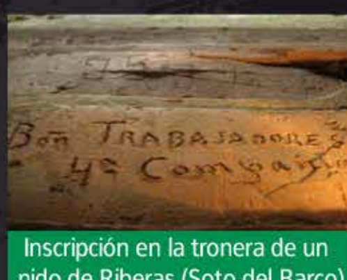
Inscripción en la tronera de un nido de Riberas (Soto del Barco)

Como anécdota destacar que en varios nidos de ametralladora se conservan inscripciones realizadas en la época de su construcción.