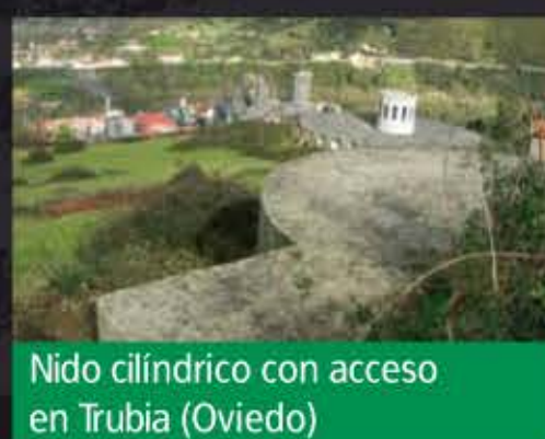
Nido cilíndrico con acceso en Trubia (Oviedo)