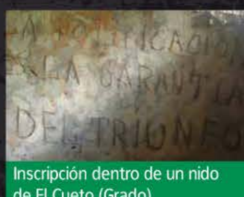
Inscripción dentro de un nido de El Cueto (Grado)