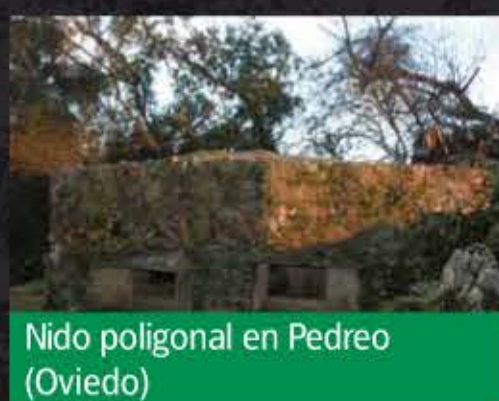
Nido poligonal en Pedreo (Oviedo)

Las troneras fueron evolucionando, de simples aperturas para disparar hasta las formas más complejas, escalonadas y en embudo, cuyo fin era evitar la entrada de proyectiles en el nido.