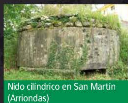
Nido cilíndrico en San Martín (Arriendas)

Podemos diferenciar varios tipos de nidos según su forma, tipos de tronera o tipo de acceso. Los más comunes son los nidos cilíndricos, aunque también los hay con forma de cúpula, rectangulares o poligonales.