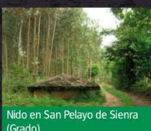
Nido en San Pelayo de Siena (Grado)