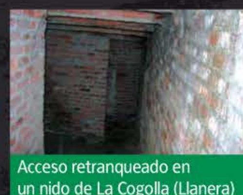
Acceso retranqueado en un nido de La Cogolla (Llanera)

Los nidos también se diferencian por su acceso. Fue evolucionando del directo, por detrás de las troneras, al indirecto, subterráneo o retranqueado, buscando que entrase poca luz.