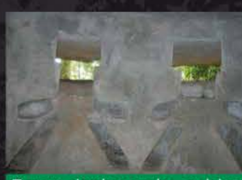
Tronera simples con los anclajes para la ametralladora (Llamero-Candamo)

Las troneras fueron evolucionando, de simples aperturas para disparar hasta las formas más complejas, escalonadas y en embudo, cuyo fin era evitar la entrada de proyectiles en el nido.