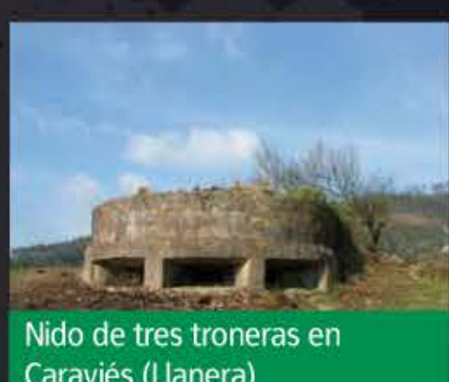
Nido de tres troneras en Caraviés (Llanera)