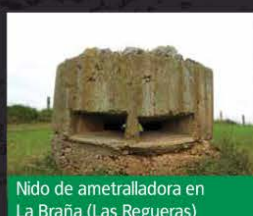
Nido de ametralladora en La Braña (Las Regueras)

Es el elemento más representativo y numeroso que aparece en cualquier escenario bélico relacionado con la Guerra Civil en Asturias. Como indica su nombre, su función era la de puesto de ametralladora o fusilero; en función de su tamaño podían albergar desde un solo hombre hasta varios (lo normal son dos o tres). Normalmente se situaban en líneas de frente o posiciones estratégicas, teniendo fundamentalmente una función de defensa. En muchos casos formaban parte de los complejos de trincheras, estando comunicados con éstas.