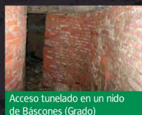
Acceso tunelado en un nido de Báscones (Grado)