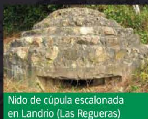
Nido de cúpula escalonada en Landrio (Las Regueras)