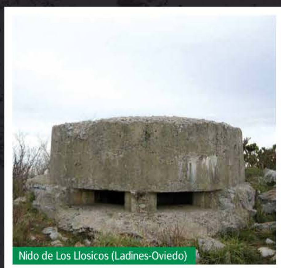
Nido de Los Llosicos (Ladines-Oviedo)

Podemos diferenciar varios tipos de nidos según su forma, tipos de tronera o tipo de acceso. Los más comunes son los nidos cilíndricos, aunque también los hay con forma de cúpula, rectangulares o poligonales.