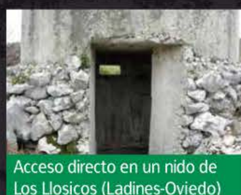
Acceso directo en un nido de Los Llosicos (Ladines-Oviedo)