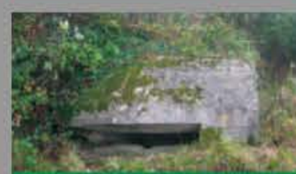
Puesto de Observación en Villarmil (Oviedo)