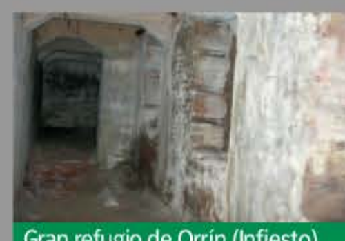
Gran refugio de Orrín (Infiesto)