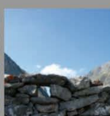
Parapeto en los Gabuxeos (Lena)