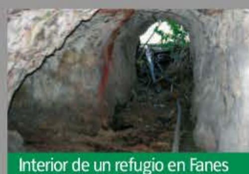
Interior de un refugio en Fanes (Llanera)

La función básica de los refugios es proteger a las personas, bien soldados o población civil, de los ataques enemigos. Por lo general, los refugios para la población civil son más consistentes y de mayor tamaño, hechos de hormigón; se sitúan muy cerca de las poblaciones. Los refugios para los soldados son más simples, a veces simples oquedades naturales o excavadas directamente en el terreno. Los refugios catalogados han sido 47.