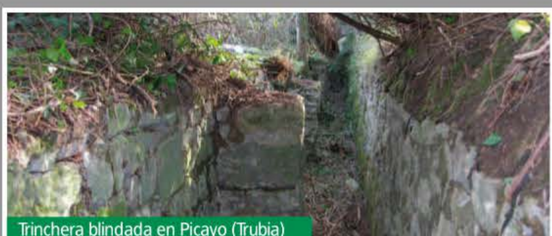
Trinchera blindada en Picayo (Trubia)