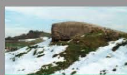
Puesto de Observación en la Llobera (Oviedo)