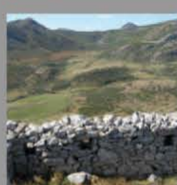
Parapeto en Peña Cuérrabos (Somiedo)