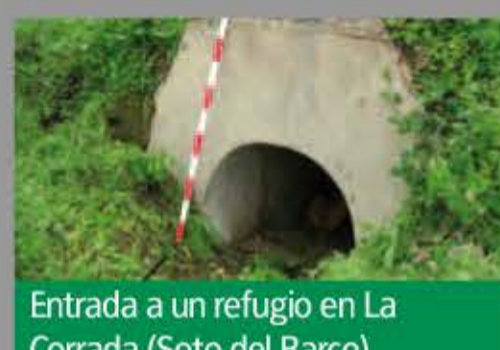
Entrada a un refugio en La Corrada (Soto del Barco)