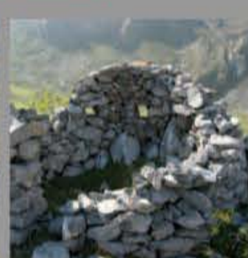
Parapeto en la Vega del Meicín (Lena)