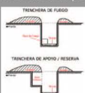
Esquema de una trinchera