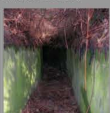
Trinchera blindada en Ranón (Soto del Barco)