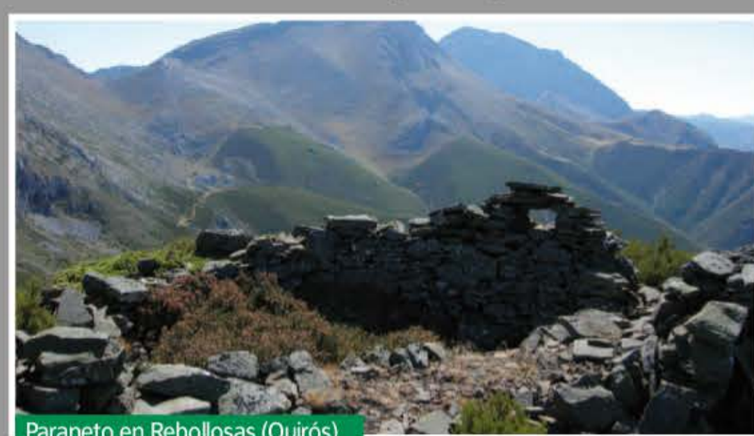
Parapeto en Rebollosas (Quirós)

Son las construcciones defensivas más simples. De piedra, constan de muros, a veces aspillerados, donde protegidos por sacos terreros se instalaban los soldados para disparar. Son más propios de zonas de montaña. Suelen estar ligados a trincheras. Se han localizado y catalogado un total de 14.