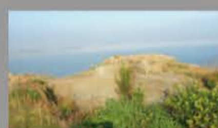
Puesto de Observación en San Juan de Nieva (Gozón)