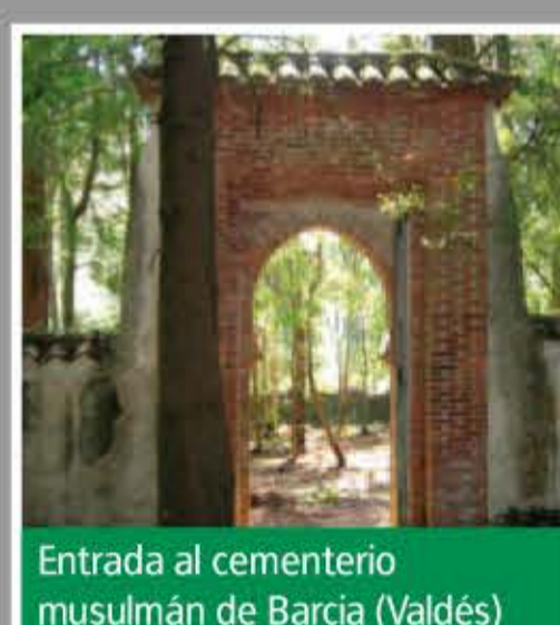
Entrada al cementerio musulmán de Barcia (Valdés)

El cementerio musulmán de Barcia (Valdés) está realizado durante la contienda; daba sepultura a los soldados de los tabores que luchaban, principalmente, en la zona del pasillo de Grado. Se trata de un recinto rectangular de más de 3.000 metros cuadrados; en las esquinas aparecen garitas aspilleradas. La entrada al recinto está en el lado SE mediante una puerta con arco de herradura al estilo musulmán. En total quedan 48 enterramientos, en estado de abandono.