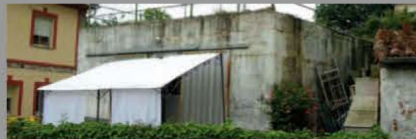
Polvorín del Alto del Escamplero (Las Regueras)

Los polvorines son sólidas construcciones que servían como almacén de armamento y explosivos. Algunos de ellos están a retaguardia, para aprovisionar al frente, mientras que otros aparecen ligados a otras construcciones, sobre todo baterías artilleras. Su tamaño varía según su ubicación, siendo los de retaguardia más sólidos y grandes que los que aparecen en el frente, que en ocasiones pueden ser simples excavaciones en tierra o, incluso, estar dentro de una edificación mayor.