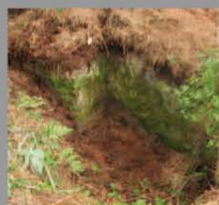
Pozo de tirador en la Sierra de Pedroso (Candamo)

Como su nombre indica su función era albergar uno o dos tiradores de fusil. Están ligados a las trincheras, pudiendo decirse en muchos casos que son un ensanchamiento de éstas. Suelen ser semicirculares, con muros de piedra y, en su origen, protegidos por sacos terreros.