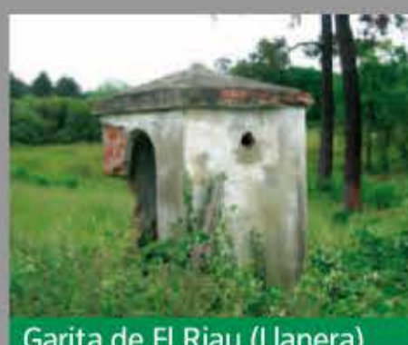
Garita de El Riau (Llanera)

Se trata de pequeñas edificaciones destinadas a un soldado. Suelen estar ubicadas junto a baterías artilleras, polvorines o zonas logísticas. En general son de planta troncocónica, con un acceso y tres pequeñas aspilleras por donde se vigilaba.