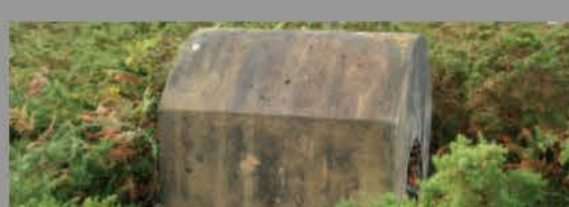
Polvorín en Cuevas de Mar (Llanes)