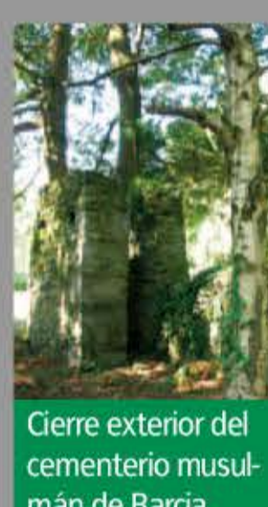
Cierre exterior del cementerio musulmán de Barcia.