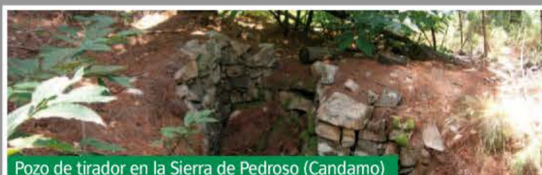
Pozo de tirador en la Sierra de Pedroso (Candamo)