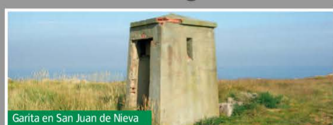
Garita en San Juan de Nieva

Se trata de pequeñas edificaciones destinadas a un soldado. Suelen estar ubicadas junto a baterías artilleras, polvorines o zonas logísticas. En general son de planta troncocónica, con un acceso y tres pequeñas aspilleras por donde se vigilaba.