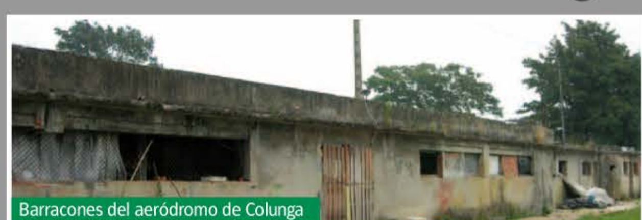
Barracones del aeródromo de Colunga

En Asturias fueron varios los aeródromos que existieron. Al ya existente de La Morgal, en Llanera, hay que sumar los de Mestas (Gijón), Vega (cerca de La Camocha), Sariego, Siero, una pista auxiliar junto al puerto de Avilés, Jarrío (Coaña), El Valle (Carreño), Colunga, Cué (Llanes) y Llamigu (Llanes). Salvo el de Jarrío, el resto fueron del bando republicano.