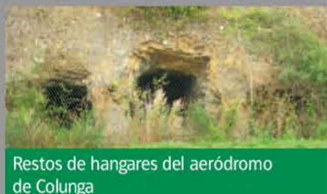
Restos de hangares del aeródromo de Colunga

El de Colunga se puede considerar el mejor conservado del norte de España. Quedan restos de un nido de ametralladora, los hangares y, sobre todo, los barracones de los soldados y los mandos.