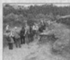
Un grupo de visitantes recorre el castro de Coaña.

A partir de las dos y media de la tarde se iniciará la romería, con una comida comunitaria, y el sonido de gaitas y acordeón, a cargo de "Os Parrapitos" y Francisco. La jornada festiva, que está previsto que finalice a las ocho de la tarde, incluye además juegos populares.