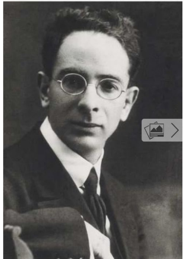
Leopoldo Alas Argüelles.

El volumen incluye un total de 150 crónicas periodísticas firmadas por Alas Argüelles y publicadas en diversos periódicos y revistas de la época. Este corpus se completa con el estudio "La España del Rector Alas", realizado por Joaquín Ocampo y por Sergio Sánchez Collantes (profesor-doctor de Historia Contemporánea de la Universidad de Burgos), así como con una semblanza biográfica con numerosos datos inéditos del jurista ovetense realizada por Francisco Galera Carrillo.