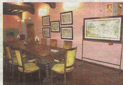
Arriba, libros en la biblioteca donada a la Fundación Valdés-Salas. Sobre estas líneas, la segunda sala de mapas.

tante adquiere «una visión bastante amplia y precisa de cómo se veía el mundo antes del descubrimiento de América». Así resumió Lorences la importancia de la muestra cartográfica, al tiempo que resaltaba algunas de las peculiaridades que han dado a cada una de las obras expuestas un lugar en la historia del Mundo.