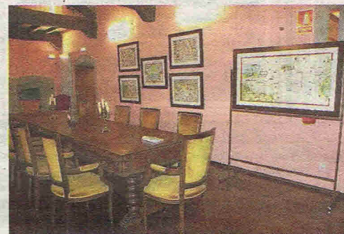
Arriba, libros en la biblioteca donada a la Fundación Valdés-Salas. Sobre estas líneas, la segunda sala de mapas.

tante adquiere «una visión bastante amplia y precisa de cómo se veía el mundo antes del descubrimiento de América». Así resumió Lorences la importancia de la muestra cartográfica, al tiempo que resaltaba algunas de las peculiaridades que han dado a cada una de las obras expuestas un lugar en la historia del Mundo.